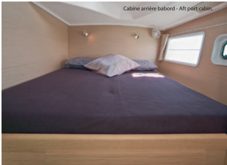
Cabine arrière babord - Aft port cabin.